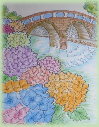
『古い橋と花』森光様制作