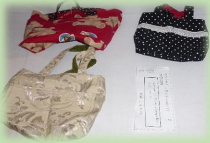
左 制作 八谷看護師