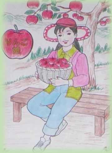
『りんご娘』福元様制作