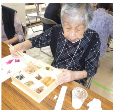
豪華なお弁当が出ました！