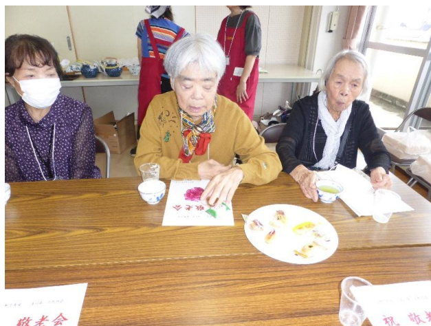
入居者の皆さんも参加させて頂きました。