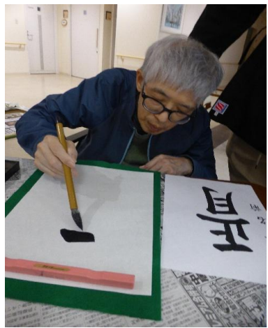
恒例の書初めを行いました。お手本を見ながら真剣に書かれているのが、写真からも伝わります。