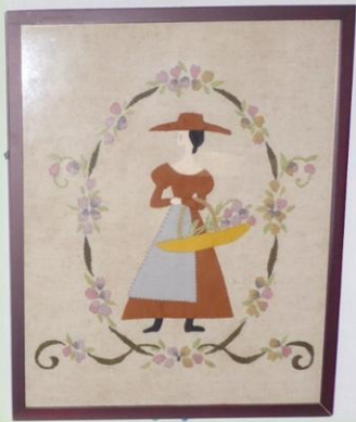
右 後藤奈美子様制作