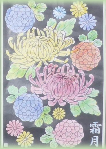
『霜月 菊文様』堺様制作