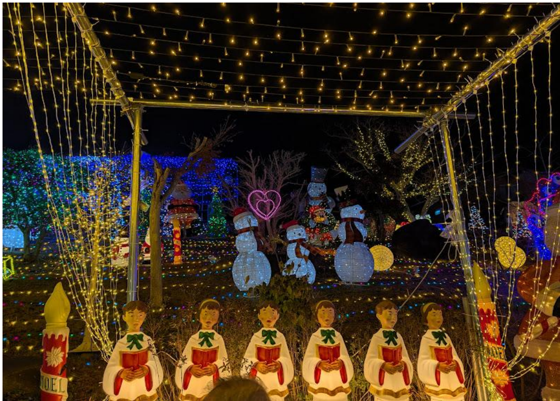
道の駅おおとう桜街道の冬のイルミネーション(福岡県大任町)