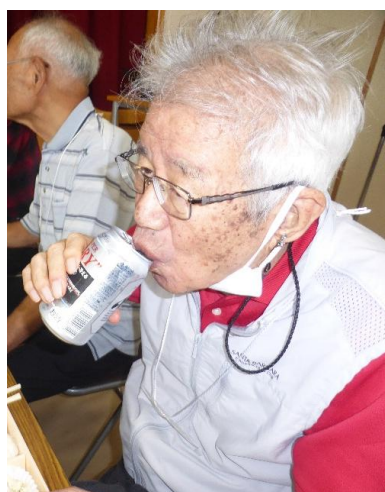
ビールを飲む若狭様