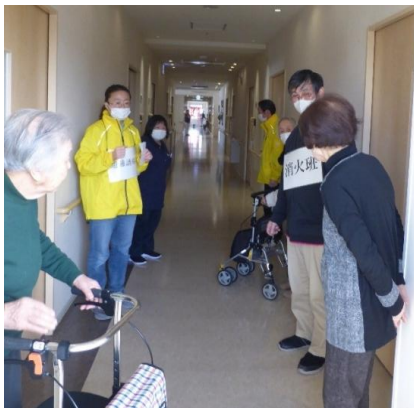
入居者様も参加してくださいました。